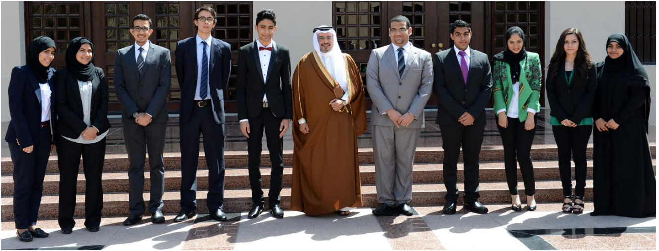
صاحب السمو الملكي ولي العهد يستقبل الطلبة الحاصلين على بعثات عام 2013 بقصر الرفاع، مملكة البحرين.

وبالنسبة لطلبة البرنامج من خريجي المدارس الثانوية الحكومية فإنه يتم إلحاقهم بمدارس داخلية لمدة سنتين قبل التحاقهم بالجامعة لتقوية لغتهم الإنجليزية ومهارات كتابة البحوث. ولقد كانت النتائج متميزة فيما يتعلق بالحصول على مقاعد في أرقى الجامعات لمجموعة من الطلبة البحرينيين المتفوقين.